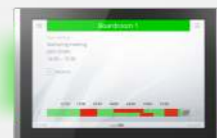
Dalle de réservation de salle