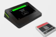
Dalle de réservation de bureau